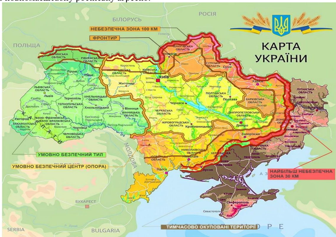
Малюнок 1. Новий макрорегіональний поділ України

Реалізація державної регіональної політики на період до 2027 року має здійснюватися на основі територіального підходу – враховувати особливості різних регіонів та функціональних типів територій при здійсненні державного втручання, координації секторальних політик в територіях, врахування нових макрорегіонів, які склались в Україні через повномасштабну російську агресію.